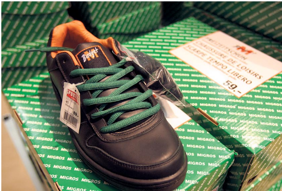
Markenzugehörigkeit von Kopf bis Fuss: Die Ausrüstung ist vorhanden, benutzt werden müsste sie noch mehr.

In den meisten befragten Unternehmen ist die Markenführung Sache der Marketingabteilung und der Geschäftsleitung (jeweils über 80% der Nennungen). Überraschend selten aber wird mit nur 23% der Bereich Unternehmensstrategie eingebunden – der CEO ist bei 40% der Unternehmen nicht